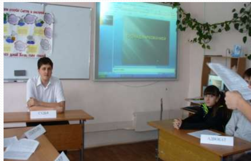
Ролевая игра «Суд над сигаретой»