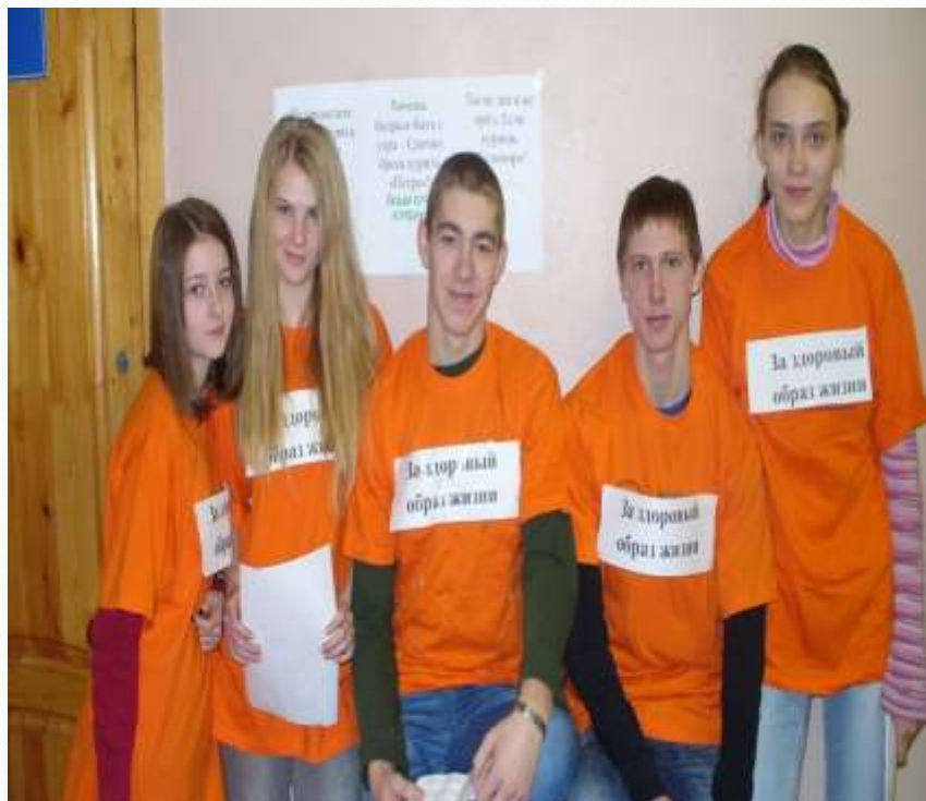
Акция «Мы здоровый образ жизни»