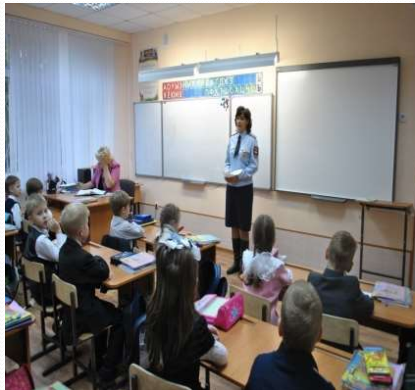
Беседа инспектора ГАИ «Знай и соблюдай ПДД»