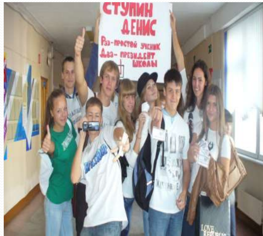
Выборы президента школы