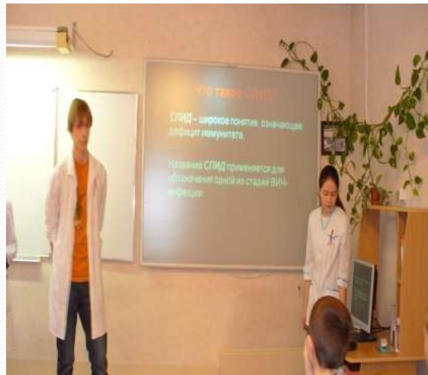
Месячник профилактики с ВИЧ