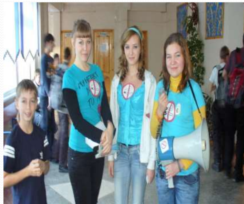
Акция «Конфетка за сигаретку»