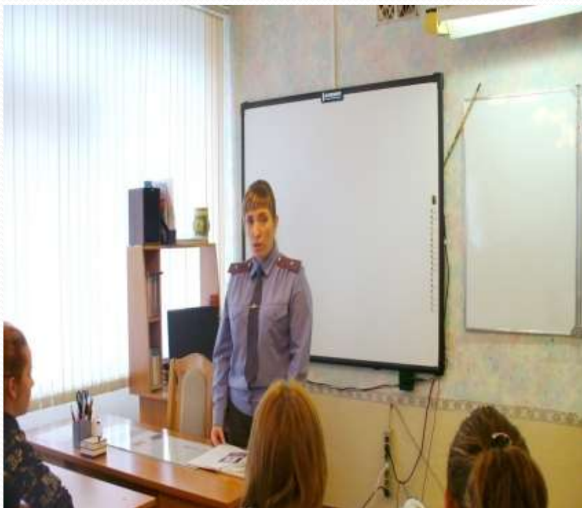
Беседа инспектора ОДН «Подросток вышел на улицу»