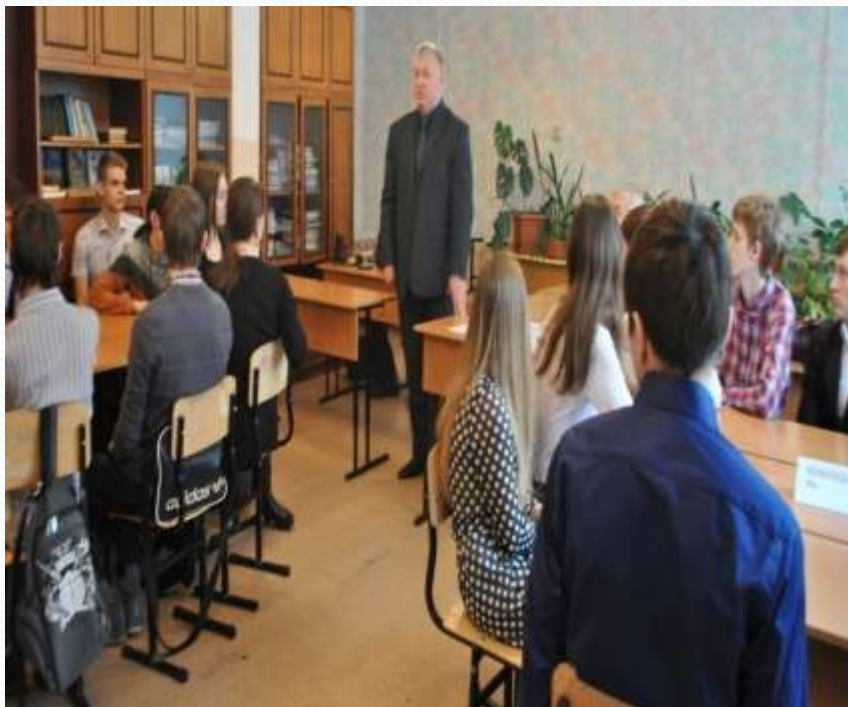
Правовой турнир с участием директора МБОУ «Лицей №112» депутатом Барнаульской Городской Думы